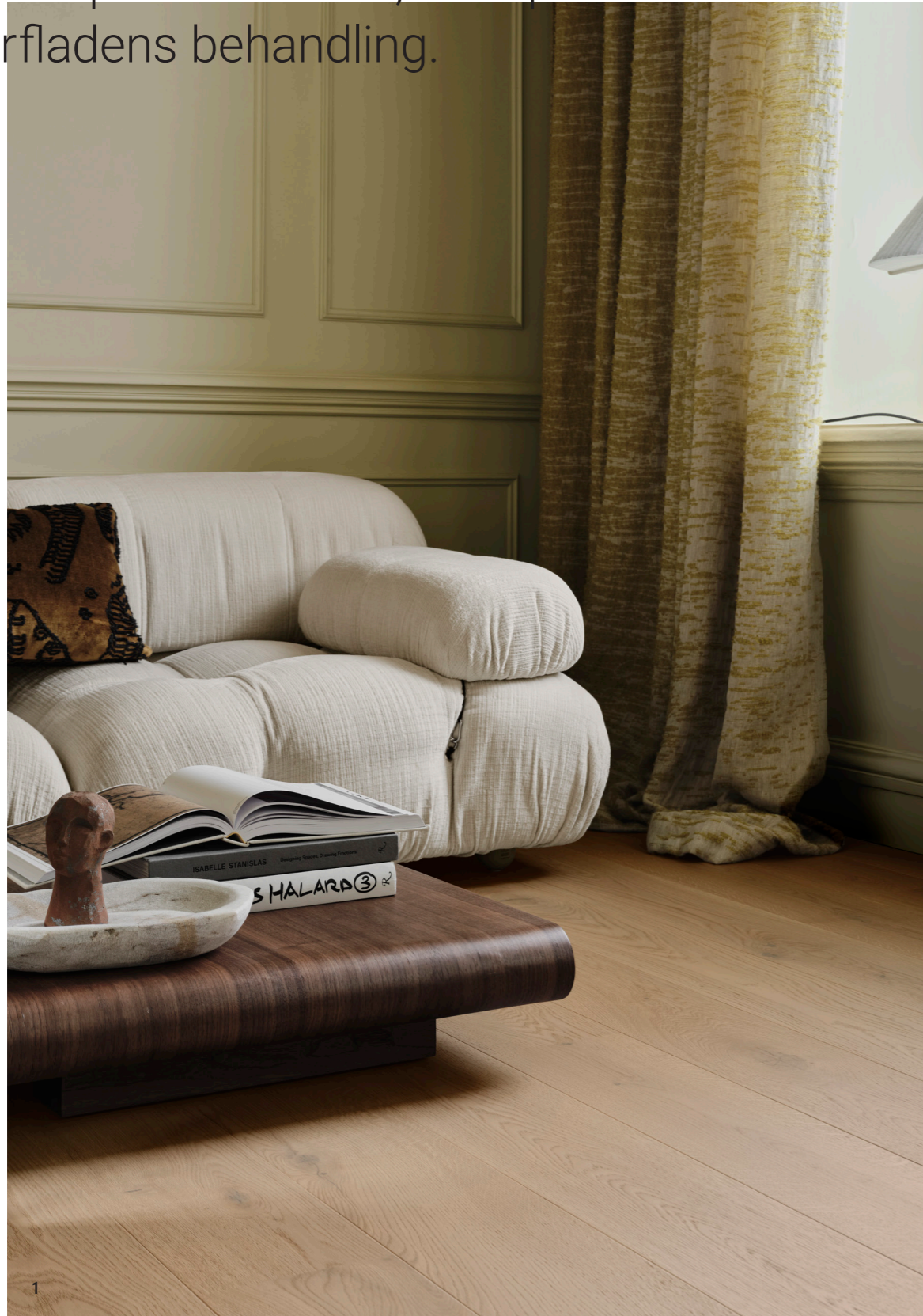
1 GRACE / Eg Beige Cashmere Plank XT / 7877069 2 NOBLE / Eg Retro / 7806007 3 SEGNO / Eg Old Brown / 41020039 4 SHADE / Eg Nutmeg Plank XT / 7879032

Når du bruger dit trægulv, slider du ikke på selve træet, men på overfladens behandling.