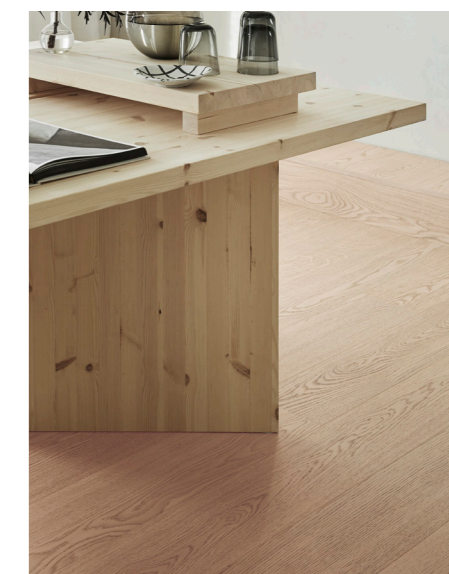
SHADE skaber en nutidig og skandinavisk følelse med naturlige forskelle og nuancer hentet fra naturen.