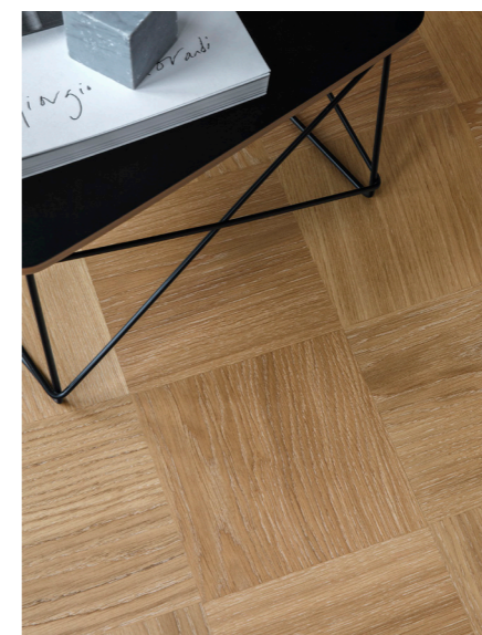
NOBLE er en smuk nyfortolkning af det klassiske parketgulv, men med moderne ternede mønstre.

Siden 1886 har vi fremstillet smukke, funktionelle og bæredygtige trægulve, som fungerer i det nordiske klima. Det, der begyndte med et lille snedkeri i Malmø, er i dag en af verdens største gulvvirksomheder med produktion rundt om i verden. Produktionen sker nu med det seneste inden for moderne produktionsteknik, men arven fra 1800-tallets snedkerfabrik lever videre – i håndværket, vores knowhow og respekten for råvaren. Vi arbejder stadig på at fremhæve den enkelte plankes unikke karakter. I vores syv kollektioner er der et trægulv til ethvert hjem og rum.