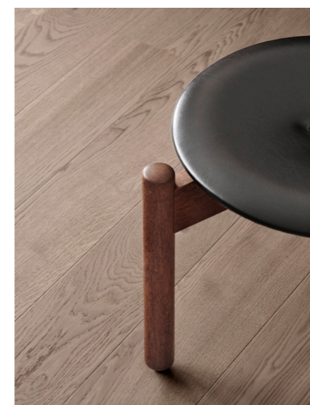
GRACE er et blødt og elegant egetræsgulv med en ren træformelse – et fint og smukt gulv, der holder længe.