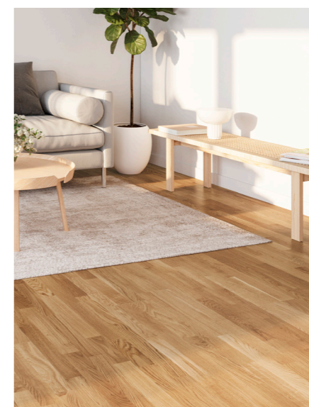
PURE er et enkelt og smukt gulv i 3-stav eller planker, som løfter træsorternes naturlige variationer.