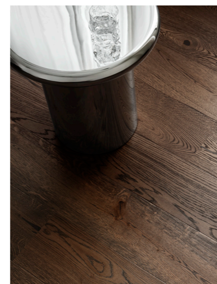
HERITAGE er rustikke egetræsgulve med brede planker, stærk karakter og detaljer formet af naturen.