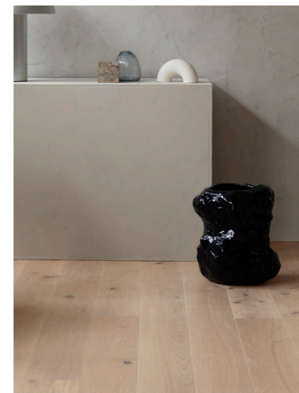
PRESTIGE er plankegulve med et blødt udtryk, som om det er blevet påvirket af sol, sand og vind.