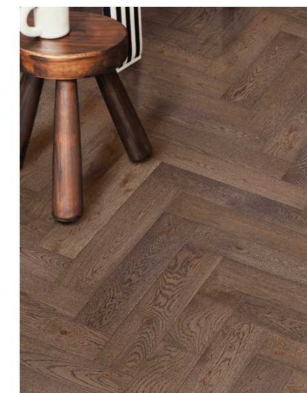
SEGNO er et solidt sildebensgulv, som kan lægges i både traditionelle og nyskabende mønstre.