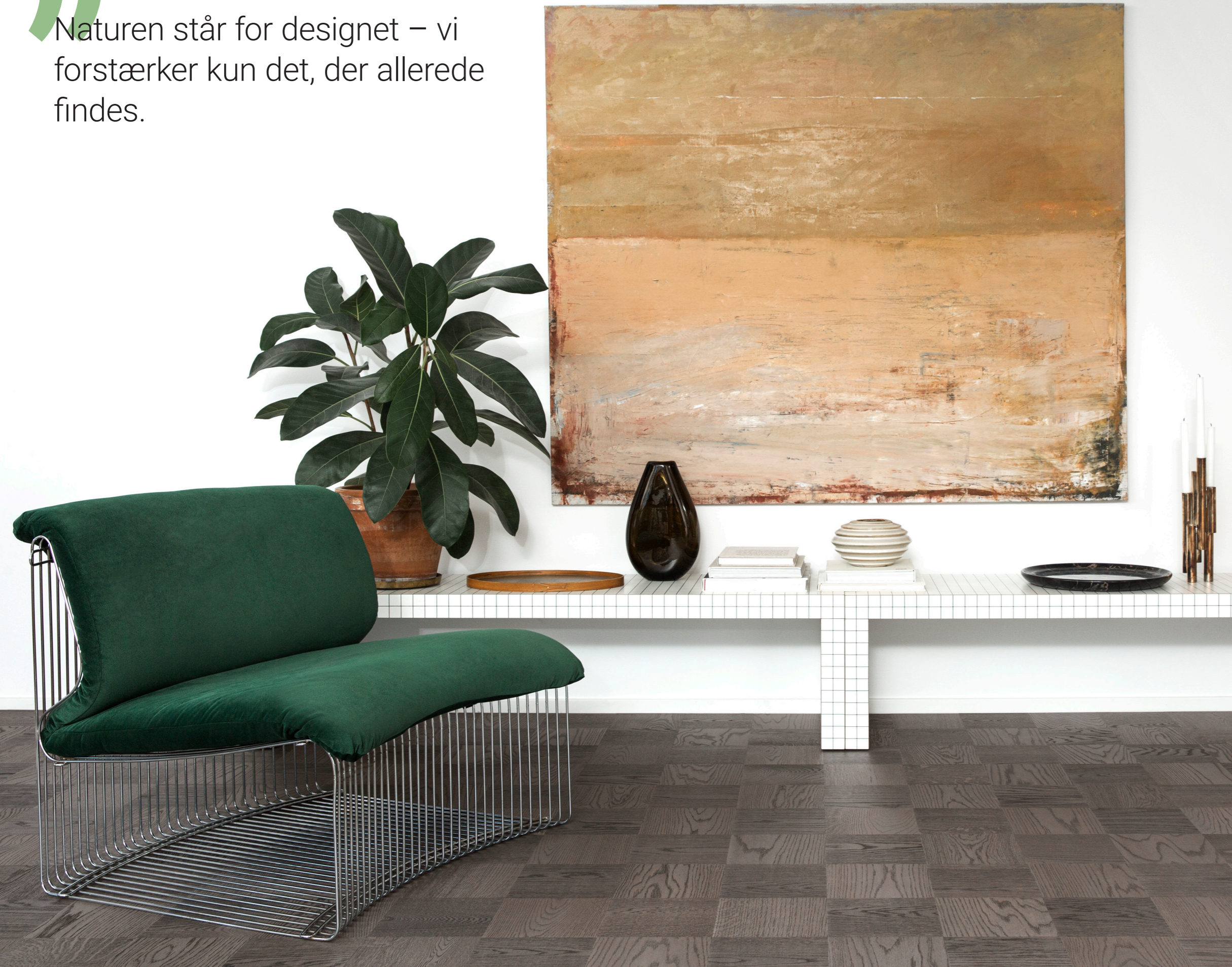
NOBLE / Eg Bronx / 7806017

Naturen står for designet – vi forstærker kun det, der allerede findes.