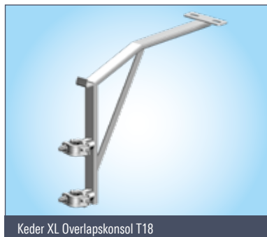
Keder XL Overlapskonsol T18