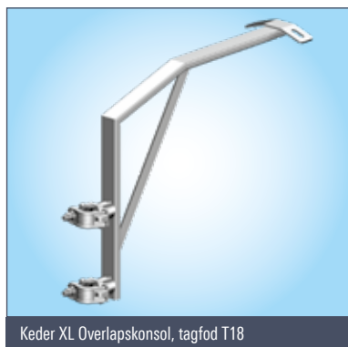
Keder XL Overlapskonsol, tagfod T18