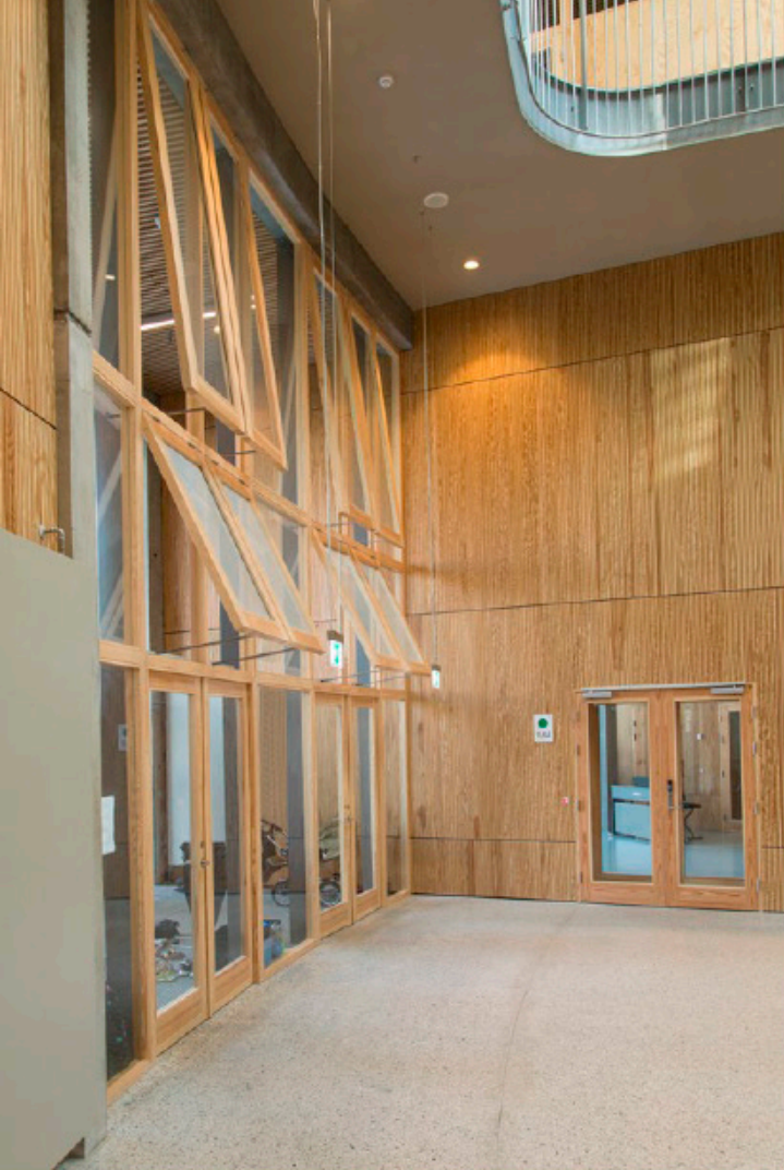
Projektspot fra Kalvebod Fælled Skole. Indgangsparti. 6,3 meter højt træ-, dør- og glasparti med røgventilation.