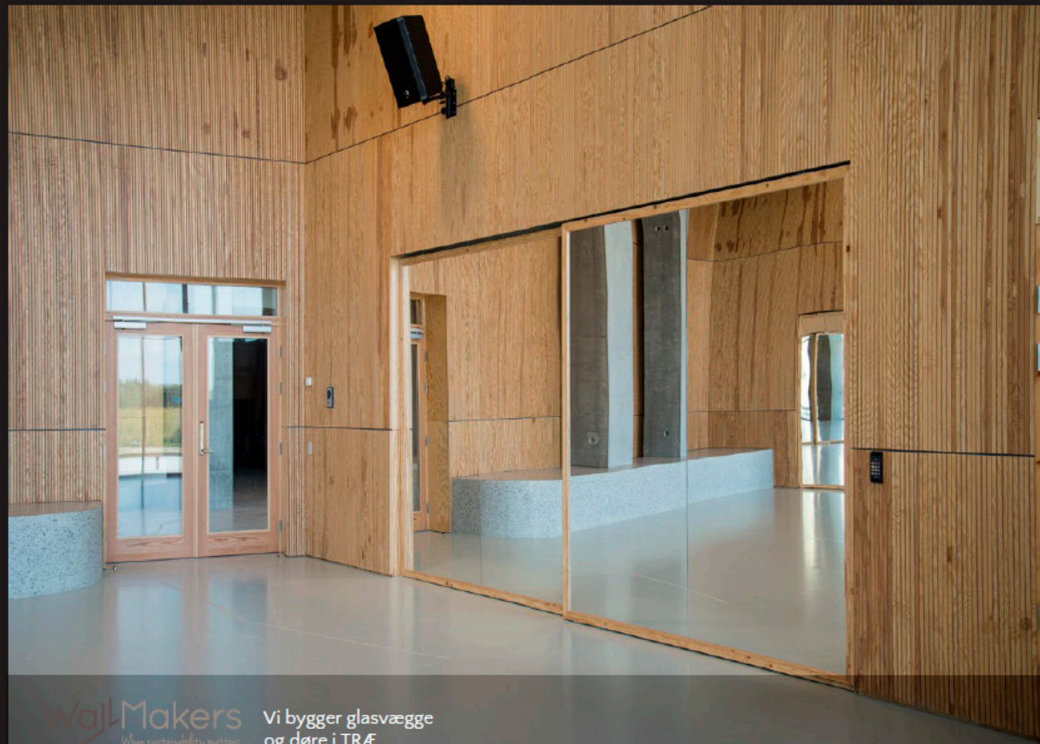
Projektspot fra Kalvebod Fælled Skole. Lille gymnastiksal Dobbelt glasrammedør EI60 med adgangskontrol.