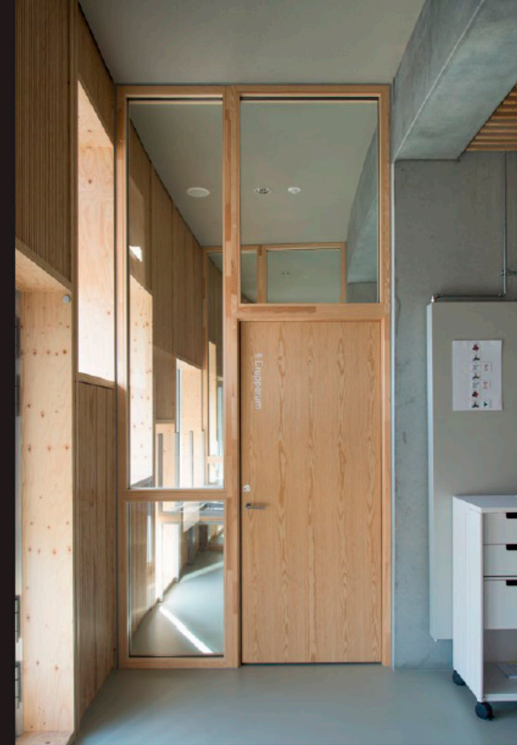
Projektspot fra Kalvebod Fælled Skole. Undervisningslokaler. Brandklassificeret EI30, lyd målt på stedet til R'w 44 dB - trædør i skrællet fyrre finér.